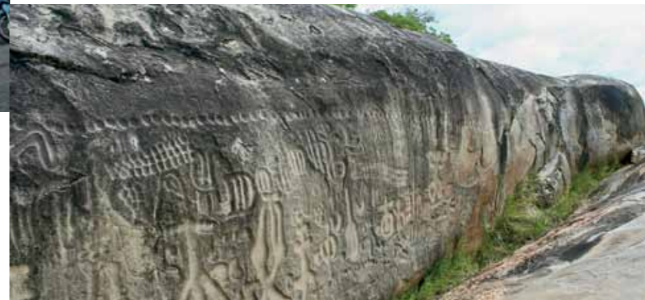
BELEZAS E DELÍCIAS Na página ao lado, a charmosa área de degustação do engenho Triunfo. Acima, em sentido horário: fachada do primeiro teatro do estado; o bode, principal personagem do Cariri; sapato feito com algodão colorido e as inscrições misteriosas da Pedra do Ingá

funcionando o Teatro Minerva, o primeiro do estado. Construído em 1859, a pedido dos descendentes dos donos de engenhos que voltavam de suas temporadas na Europa sentindo falta de um pouco de cultura, tem acústica perfeita e madeira original da época. No campus da Universidade Federal da Paraíba, o Museu da Rapadura mostra a evolução do maquinário, com exposição de peças originais.