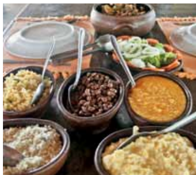
Comida típica servida no Pai Mateus

→ Hotel Village: Em Campina Grande, o quatro estrelas é bem mais urbano que os outros meios de hospedagem. Os apartamentos são equipados com ar condicionado, frigobar, cofre, TV e wireless. Na área de lazer, o hotel oferece piscinas, salas de jogos e de ginástica, quadra poliesportiva e SPA. Fica bem próximo dos acessos rodoviários para o litoral, sertão e brejo. www.hoteisvillage.com.br e (83) 3310-8000.